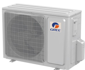
UM 12 - 18