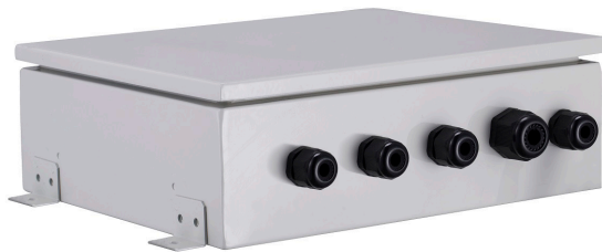
Boîtier de contrôle

Une interface qui permet de connecter des unités de traitement d'air disposant d'une batterie à détente directe aux unités extérieures de GMV. Chaque kit CTA est équipé d'une vanne, d'un détendeur électronique et d'une télécommande. Ce kit complet (sonde et télécommande fournies) est utilisé pour traiter la température de l'air de ventilation.