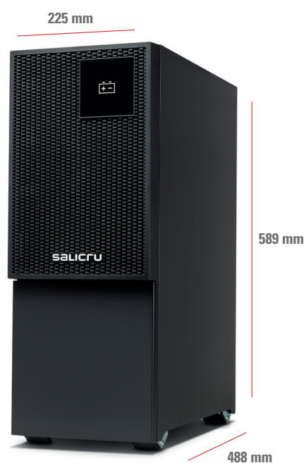
EBM - SLC TWIN PRO3