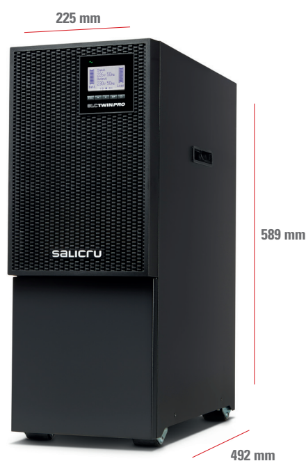
SLC 4000÷10000 TWIN PRO3