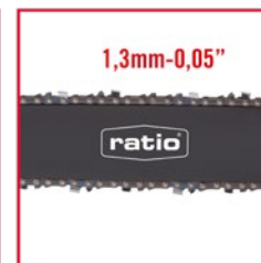
Cadena 57 eslabones