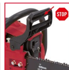
Freno automático de cadena