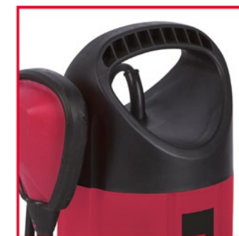
Asa de transporte