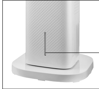
Ventana del nivel de agua

Preste atención a los siguientes puntos: