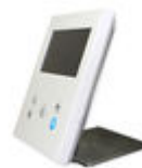
F09420 SOPORTE SOBREMESA MONITOR VEO- XS/VEO-XL