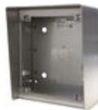
F04645 CAJA SUPERFICIE MARINE ST1