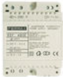
F04802 ALIMENTADOR DIN4 230VAC/12VAC-1A