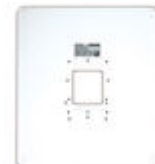
F03389 MARCO UNIVERSAL LARGE