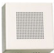
F02040 PROLONGADOR LLAMADA TELEFONO