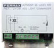
F02438 ACTIVADOR LUCES-TIMBRE VDS