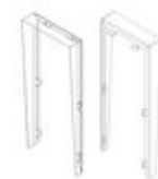
F04701 VISERA MARINE ST1