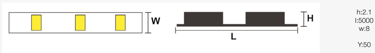
Esquema de Producto. Product line drawing