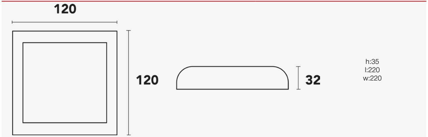
Esquema de Producto. Product line drawing