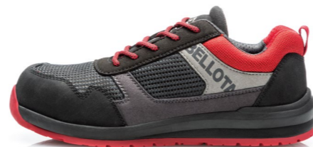
► 72350BR-S1P TALLAS DE LA 36-47