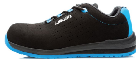
► 72351B-S1P TALLAS DE LA 36-47