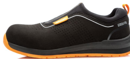
► 72352B-S1P EASY FIT SIN CORDONES