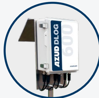
AZUD DLOG 600