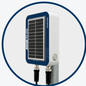
AZUD DLOG 200