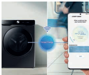
Inteligencia Artificial y SmartThings™