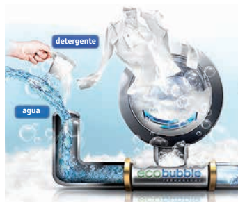
Tecnología AI EcoBubble™