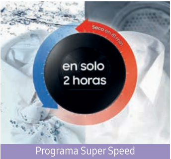
Programa Super Speed