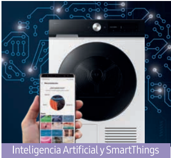
Inteligencia Artificial y SmartThings