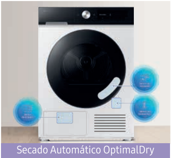
Secado Automático OptimalDry