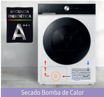
Secado Bomba de Calor