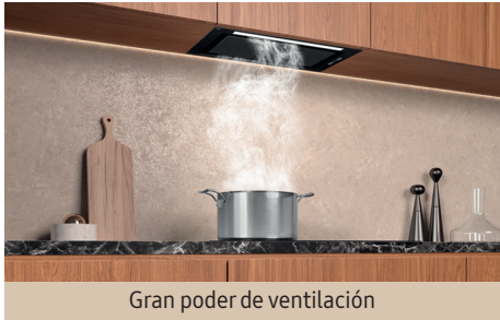
Gran poder de ventilación