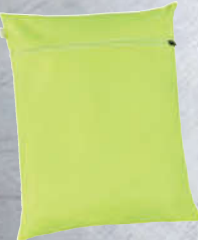
Stowable stuff bag to keep clean