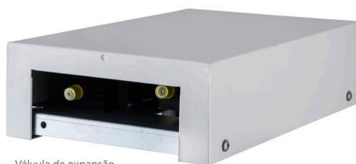
Válvula de expansão