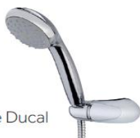
Equipamento de duche Ducal