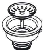
Válvula 3 1/2"