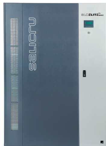
► Equipo SLC ELITE MAX