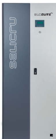
► Equipo SLC ELITE