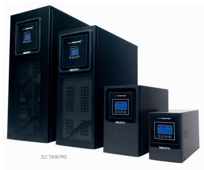
SLC TWIN PRO