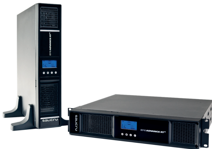
SPS ADVANCE RT