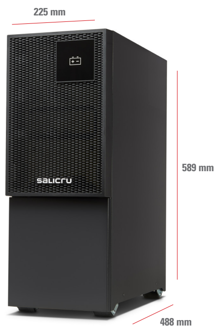
EBM - SLC TWIN PRO3