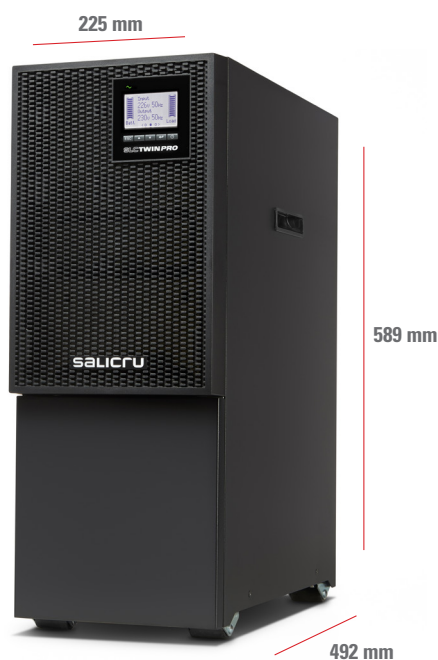
SLC 4000-10000 TWIN PRO3