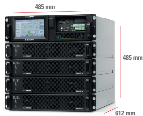
SLC-#/4 ADAPT 27 A