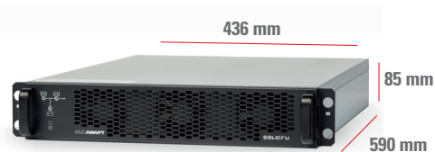
SLC ADAPT2 6 A SLC ADAPT2 9 A