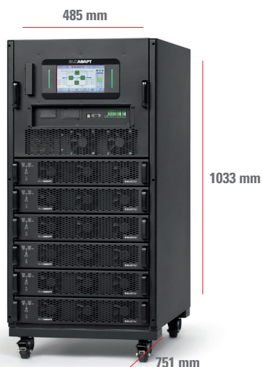
SLC-#/6 ADAPT 54 A