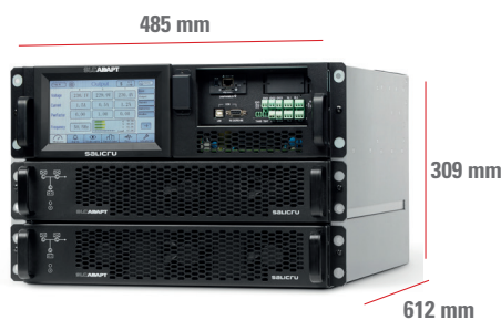
SLC-#/2 ADAPT 18 A