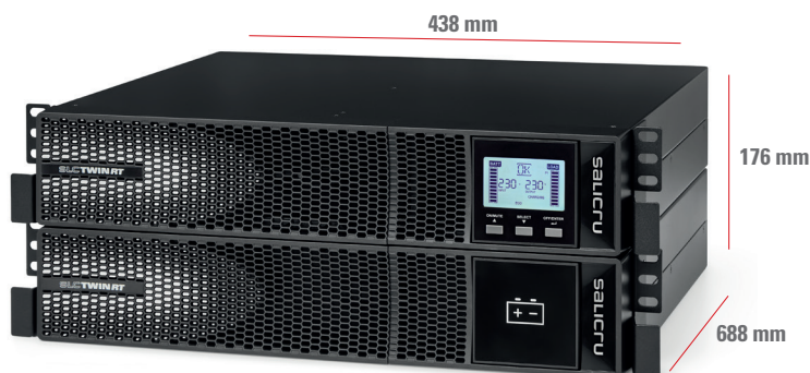
SLC 4000÷10000 TWIN RT2