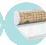
URSA PUREONE Pure 32QP