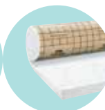
URSA PUREONE Pure 40 RP