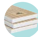
URSA PUREONE Pure 32PP