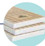
URSA PUREONE Pure 38 PN