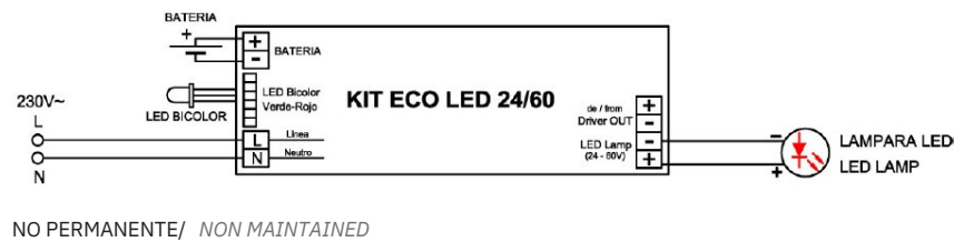
NO PERMANENTE/ NON MAINTAINED