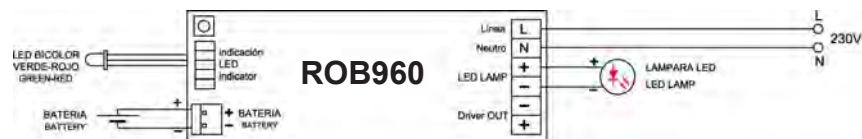
NO PERMANENTE/ NON MAINTAINED