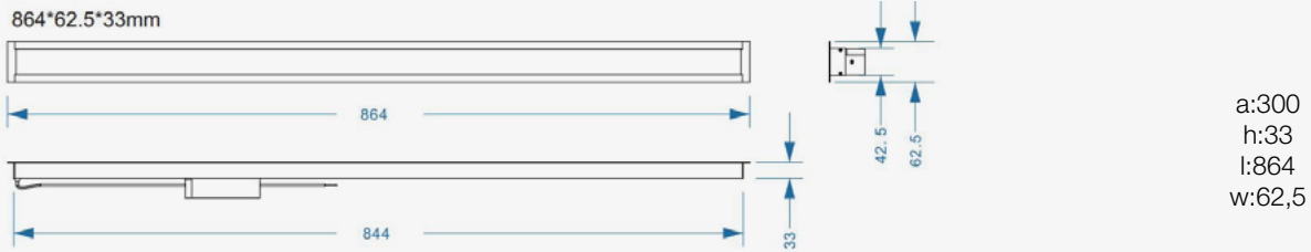
Esquema de Producto. Product line drawing