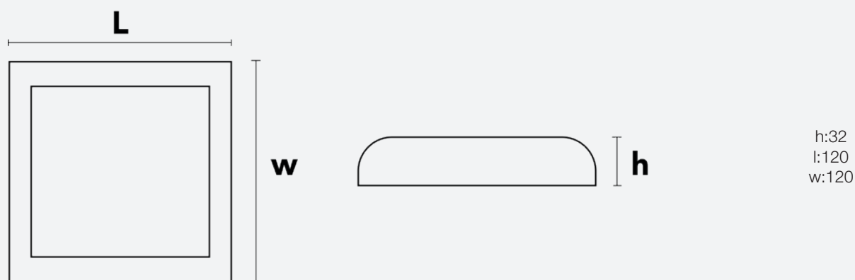
Esquema de Producto. Product line drawing