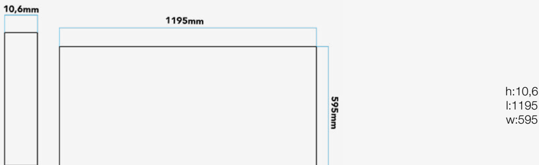
Esquema de Producto. Product line drawing