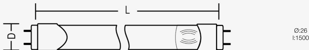
Esquema de Producto. Product line drawing