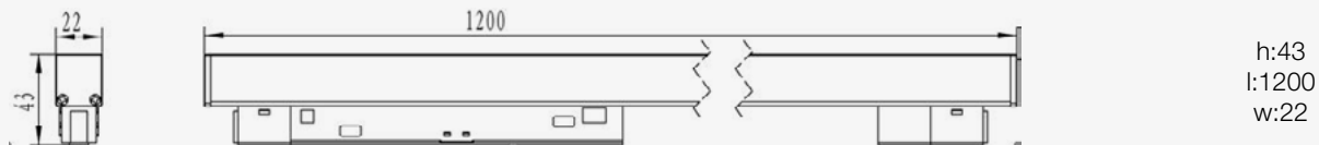
Esquema de Producto. Product line drawing