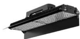
PAD3205K + VISPAD320