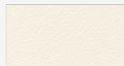
Crème (RAL 9001)