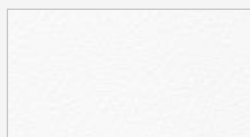
Weiß (RAL 9016)