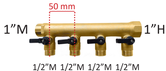
COLECTOR MODULAR MACHO-HEMBRA 1" CON VÁLVULAS DE ESFERA INCORPORADAS