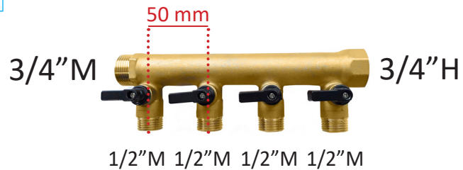
COLECTOR MODULAR MACHO-HEMBRA 3/4" CON VÁLVULAS DE ESFERA INCORPORADAS