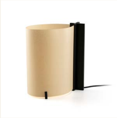
20325 ● Black ● + Natural