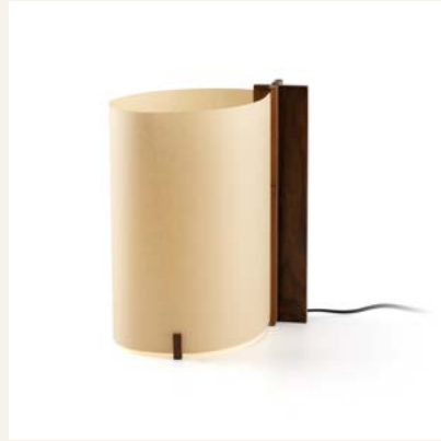
20326 ● Walnut ● + Natural