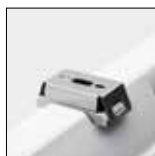
Soportes de fijación de acero inoxidable para montaje en techo