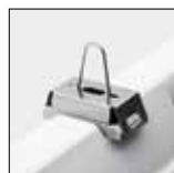
Soporte de fijación en inox para montaje suspendida