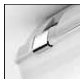
Clips de inox