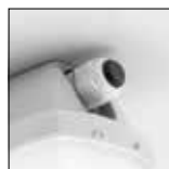
Cuerpo preparado para Loop In Loop Out