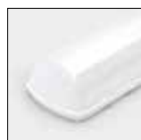
Difusor de policarbonato opal