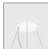
Caixa de alimentação trimless