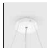
Caixa de alimentação saliente