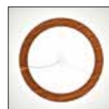
Acabamento em pau ferro brilho