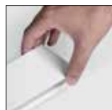
Proporção do produto