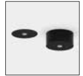
Caixas de alimentação