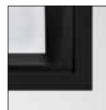
Oberfläche in Schwarz