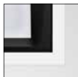
Acabamento em branco/preto