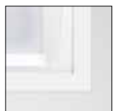
Acabamento em branco