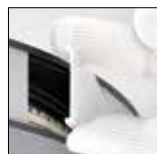
Diffuseur de clipser