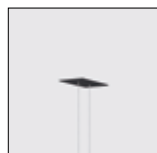
Base de techo de empotrar