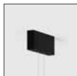
Base de techo de superficie