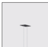
Patère de suspension trimless