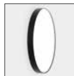
Aplicação de parede