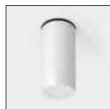
Acabamento em branco