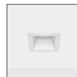
Acabamento em branco