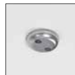
Tornillo de seguridad antivandálico