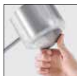
Desarrollado para soportar impactos físicos extremos de hasta 170 julios (IK17)