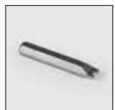
Outil pour vis antivandales